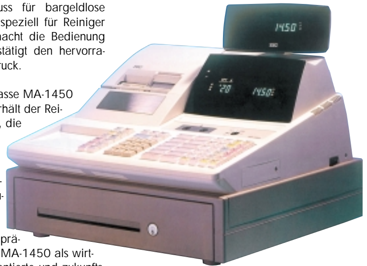
TEC MA-1450 – Textilpflegekasse von TOSHIBA TEC

Mit der Textilpflegekasse MA-1450 von TOSHIBA TEC erhält der Reiniger eine Maschine, die die Betriebsabläufe deutlich vereinfacht. Die sprichwörtliche Qualität der TEC-Maschinen garantiert zudem hohe Standzeiten und Investitionssicherheit. Damit präsentiert sich die TEC MA-1450 als wirtschaftliche, marktorientierte und zukunftsichere Branchenlösung. Und das zu einem konkurrenzlos günstigen Preis, der dem Vergleich standhält.